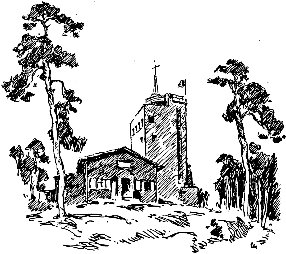
Kalmitturm und Ludwigshafener Hütte